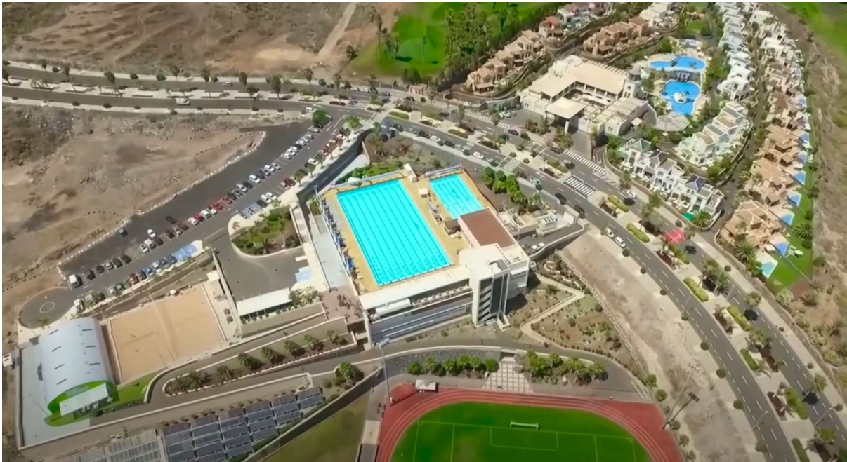
Das Tenerife Top Training (T3).